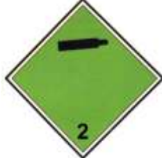
Nº 2.2 - Gases no inflamables, no tóxicos