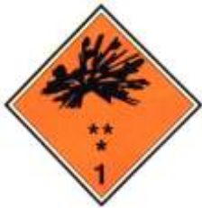
1 - Materias y objetos explosivos (1.1 - 1.2 - 1.3)