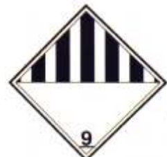
Nº 9 - Materias y objetos peligrosos diversos