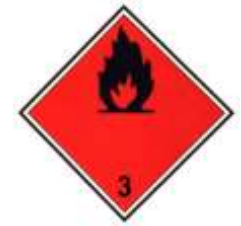
Nº 3 - Líquidos Inflamables