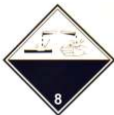
Nº 8 - Materias corrosivas