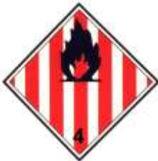
4.1 - Materias sólidas inflamables