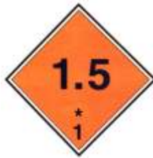
Nº 1.5 - Materias y objetos Explosivos (1.5)