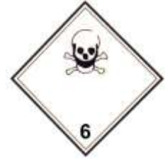
Nº 6.1 - Materias tóxicas