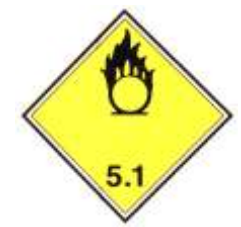
Nº 5.1 - Materias Comburentes