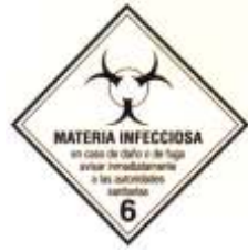
Nº 6.2 - Materias infecciosas.