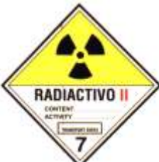
7B - Materia radiactiva categoría II