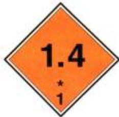
Nº 1.4 - Materias y objetos Explosivos (1.4)