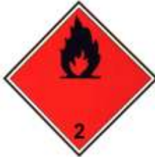
2.1 - Gases Inflamables