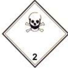
Nº 2.3 - Gases tóxicos