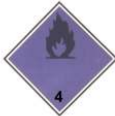
Nº 4.3 Materias que con el agua, desprenden gases inflamables