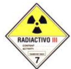
Nº 7C - Materia radiactiva categoría III