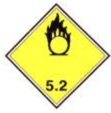
Nº 5.2 - Peróxidos orgánicos