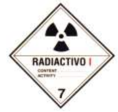
Nº 7A - Materia radiactiva categoría I