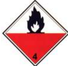
Nº 4.2 - Materias espontáneamente inflamables