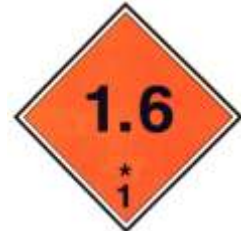
Nº 1.6 - Materias y objetos Explosivos (1.6)